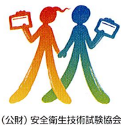
(公財)安全衛生技術試験協会

各センター及び協会本部の休業日は、土・日曜日、祝日、年末・年始(12月29日～1月3日)及び設立を記念する日(5月1日)です。